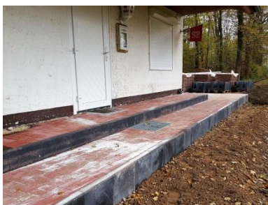
Uwe Remus Förderkreis Fußball